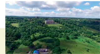
Програма з циклу «Мандрівки Україною» Zaxid.Net «Куди поїхати зі Львова на вихідні: Острозький замок» https://www.youtube.com/watch?v=hzs9Esl2bck